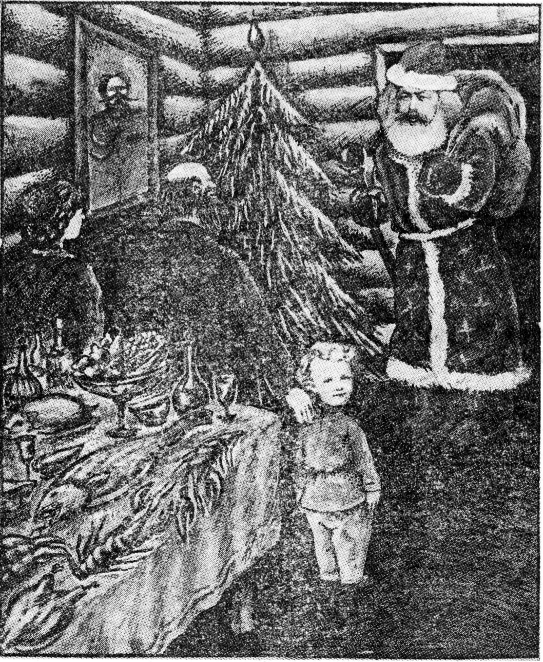
Рождественский рисунок Андрея Дородеева