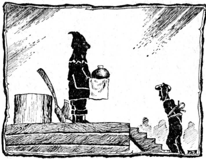
Рис. Алексея Меринова.

ВС УССР, заверил он, «во всем будет следовать духу и букве Декларации о государственном суверенитете Украины. На ее основе сейчас разрабатывается новая конституция республики. Существует два подхода: или положить в основу конституции приоритет прав человека, или исходить из социалистического выбора». Мне показалось, что Леониду Кравчуку ближе первый вариант.