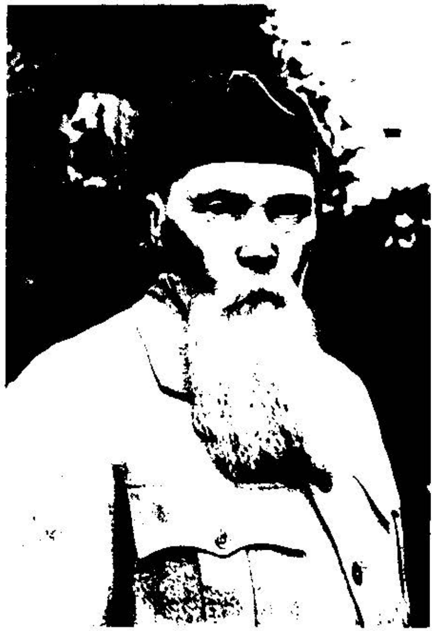
Николай Константинович Рерих 1940-е годы

ПРОЕЗД: М. "Выхино", авт. №197 до остановки "Институт молодежи" Ул. Юности, 5/1, Институт молодежи, корп.3, 5-й этаж.