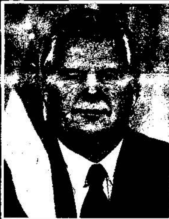
Л. М. Кравчук Кандидат в Члены Политбюро ЦК КП Украины (1990 г.) ПРЕЗИДЕНТ УКРАИНЫ