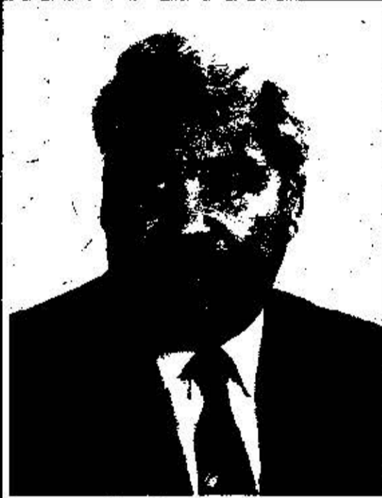
С. А. Ниязов Член Политбюро ЦК КПСС (1990-91 гг.) ПРЕЗИДЕНТ РЕСПУБЛИКИ ТУРКМЕНИСТАН