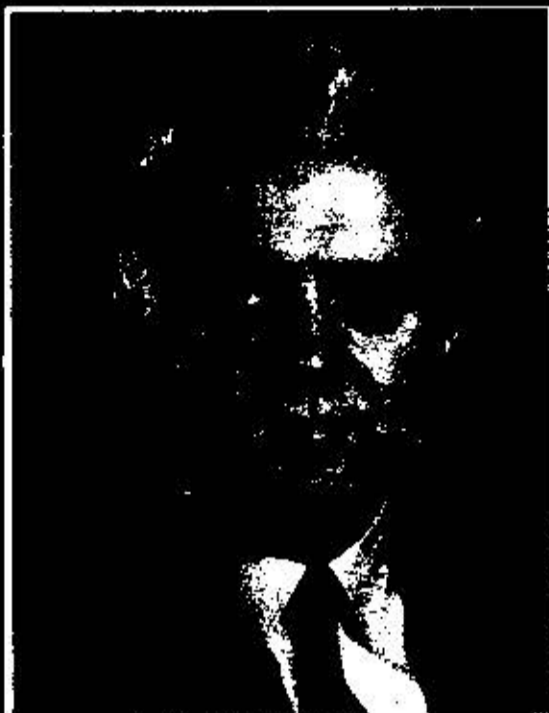
Э. А. Шеварднадзе Член Политбюро ЦК КПСС (1985-90 гг.) ПРЕЗИДЕНТ РЕСПУБЛИКИ ГРУЗИЯ