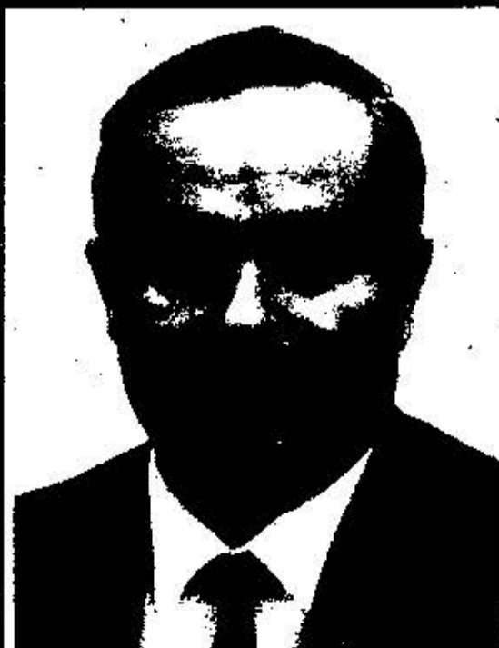
И. А. Каримов Член Политбюро ЦК КПСС (1990-91 гг.) Президент Республики Узбекистан