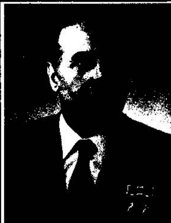
Г. А. Алиев Член Политбюро ЦК КПСС (1982-87 гг.) ПРЕЗИДЕНТ РЕСПУБЛИКИ АЗЕРБАЙДЖАН