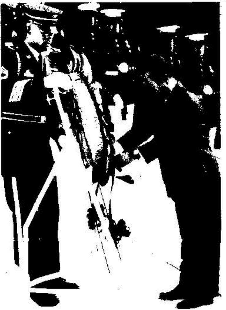
Президент Ким Ил Сун поздравляет ветерана на могилу неизвестного солдата на Арлингтонском кладбище.