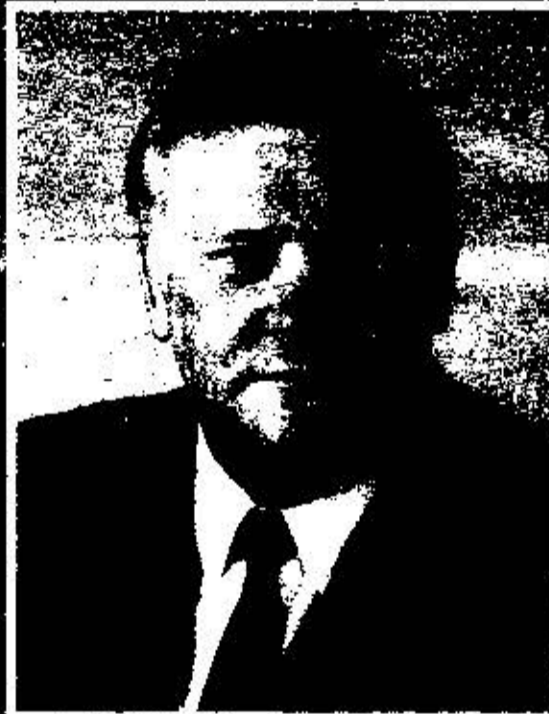
А. - М. Бразаускас 1-й секретарь ЦК КП Литвы (до 1991 г.) ПРЕЗИДЕНТ РЕСПУБЛИКИ ЛИТВА