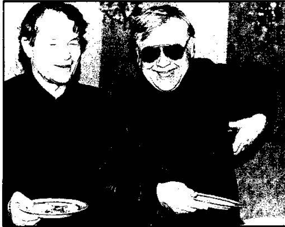
Петер Штайн и Олег Табаков.