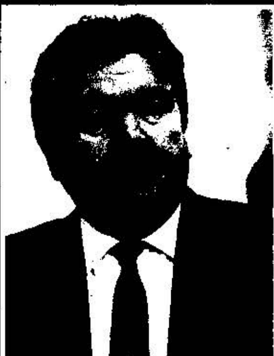
М. И. Снегур Секретарь ЦК КП Молдавии (1985-89 гг.) ПРЕЗИДЕНТ РЕСПУБЛИКИ МОЛДОВА