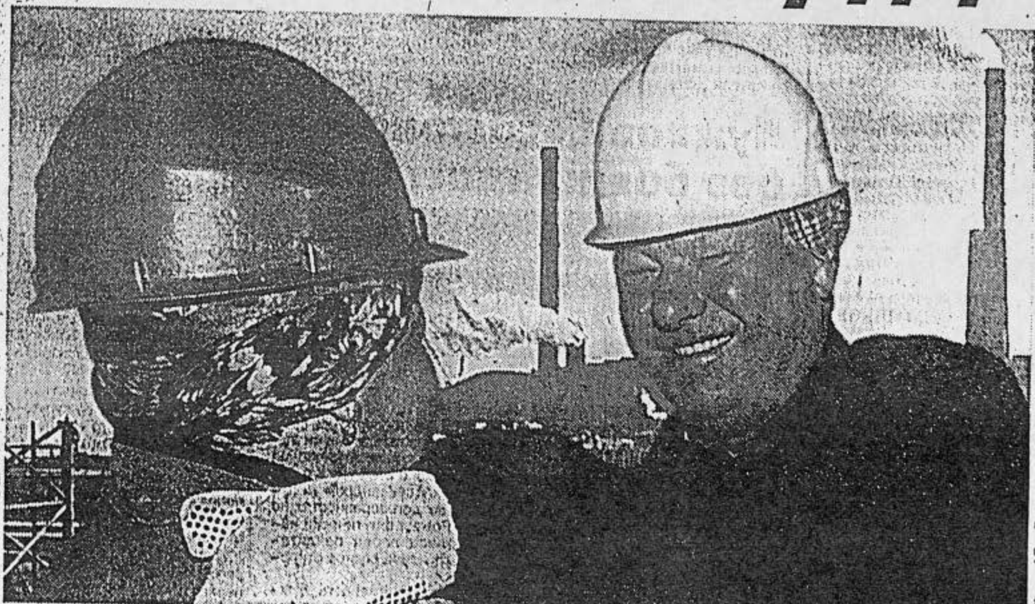
От сердца к сердцу