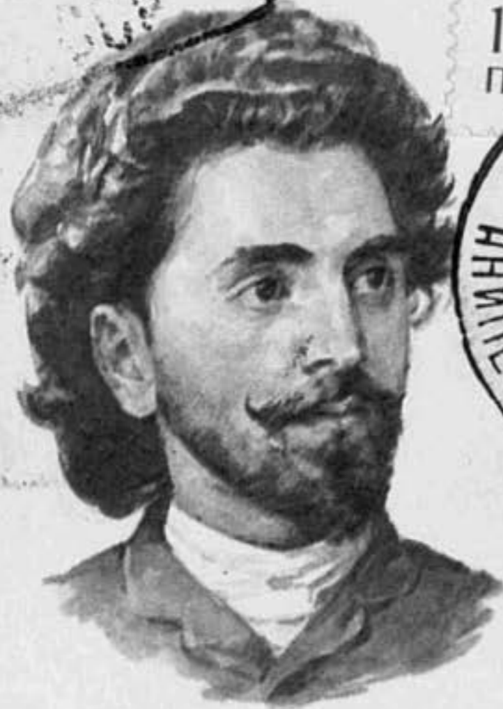
Армянский пост-демограф переводчик А. О. Цатурян • 1865—1917