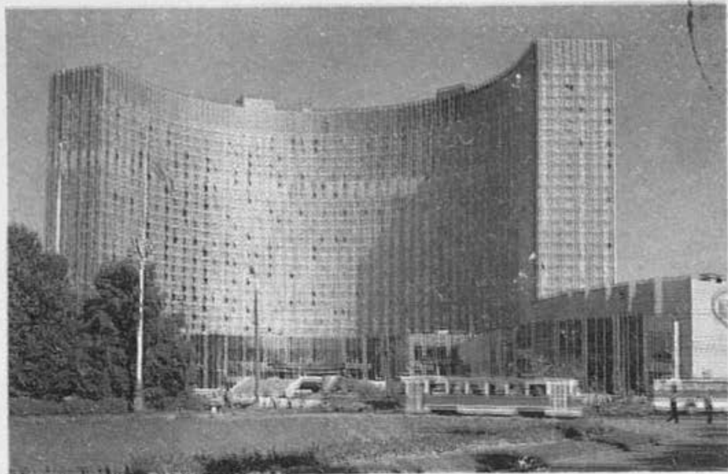
МОСКВА. Гостиница „Космос“