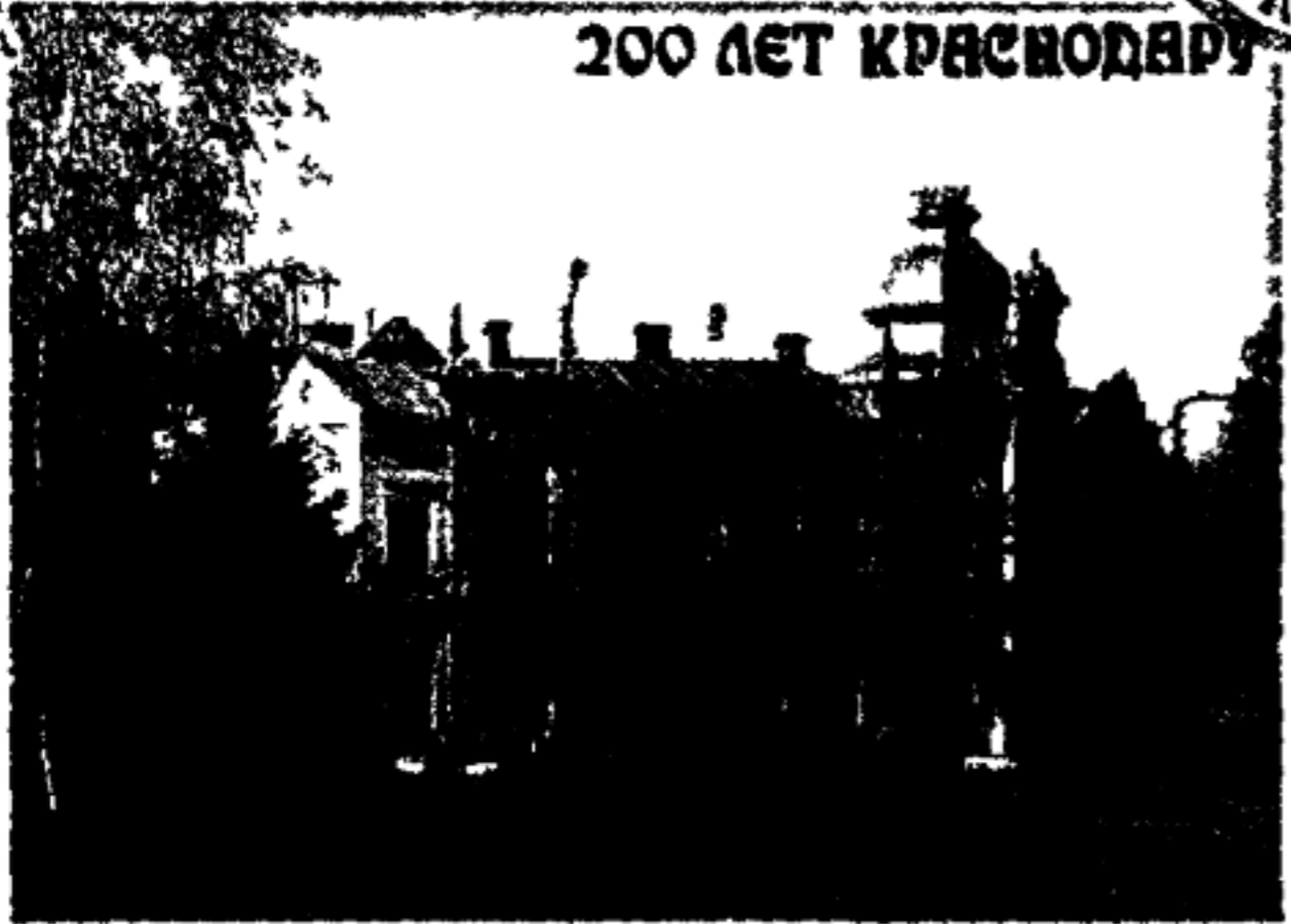
Художественный музей имени А. В. Луначарского