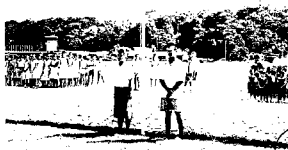
The Republic of Nauru flew the Flag of Peace and Freedom for the first time in 1990. The President invited school children from all over the country to attend the flag raising and to read their poems and essays about Peace and Freedom.

The Flag of Peace and Freedom carries no political meaning. Its images are simple: as two birds soar, the sun pierces the grey clouds, shining down on the world. These are images of peace and freedom we all can share . . . Images that transcend words which can so often be misunderstood.