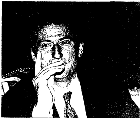
Au Forum de Crans-Montana, le président albanais Salih Berisha a reçu une réponse prudente du conseiller fédéral Jean-Pascal Delamuraz.

Seulement, le savoir-faire ne s'invente pas. Il faut aller le chercher ailleurs. Et c'est dans cette optique que Salih Berisha s'est adressé au conseiller fédéral Jean-Pascal Delamuraz. Le président albanais souhaiterait en effet que la Suisse accueille des travailleurs de son pays pour qu'ils puissent se per-