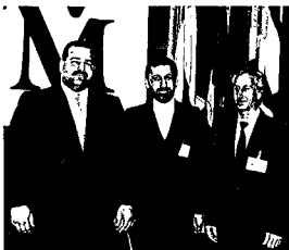
De gauche à droite: M. Rafiq Hovanesyan, Ministre des Affaires Etrangères d'Arménie - M. Ali Akbar Velatou, Ministre des Affaires Etrangères d'Iran - M. Tsvak Gassimov, Ministre des Affaires Etrangères d'Israël