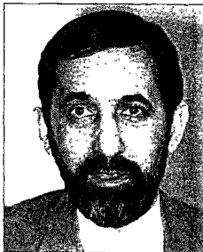
Ali Akbar Velayati: «Chaque pays a sa définition des droits de l'homme».

Oui. En Iran, le respect de l'Islam et de ses envoyés restera toujours plus