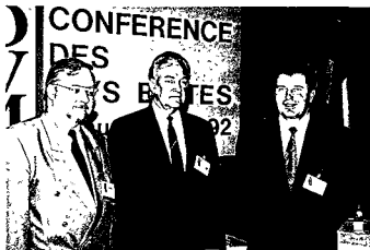
De gauche à droite: M. Vytautas Landsbergis, Président de la République de Lituanie – M. Arnold Rüütel, Président de la République d'Estonie – M. Anatolys Gorbanovs, Président de la République de Letonie