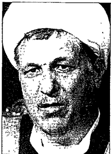
Le président Rafsanjani: une politique très active

Deux semaines après la réunion des pays de la mer Noire à Istanbul, une