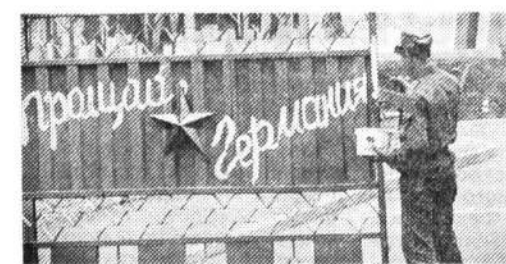
(стр. 1, 4).

Монополизм и коррупция — явления не только капиталистического мира, есть им место и в нашей жизни. Но бороться с ними можно, надо лишь власть употребить. Что и сделал районный прокурор, впервые применив антимонопольный закон, вмешавшись в сражение за валютный извоз.